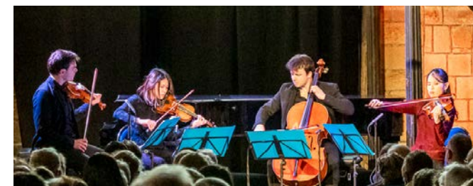
Quatuor Hermès

Théo Fouchenneret - piano Quatuor Hermès