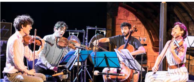
Quatuor Hanson