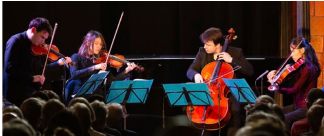
Quatuor Hermès