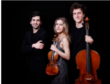
Trio Zeliha