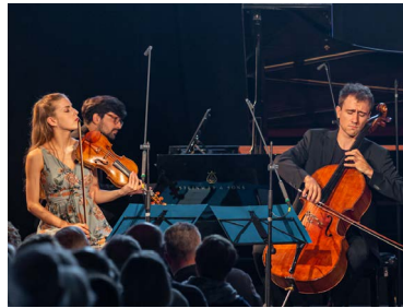
Trio Zeliha