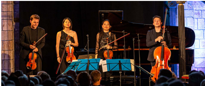
Quatuor Hermès