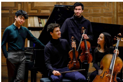
Ensemble Adélie